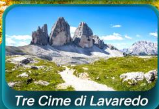
Tre Cime di Lavaredo