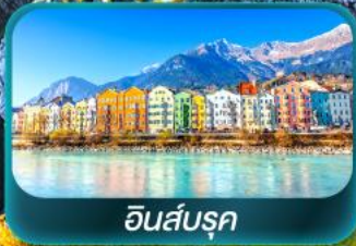
อินส์บรุค