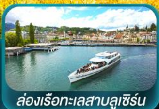
ล่องเรือทะเลสาบลูซิิร์น