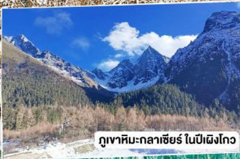
ภูเขาหิมะกลาเซียร์ ในปีเฉิงโกว