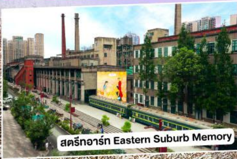
สตรีทอาร์ต Eastern Suburb Memory