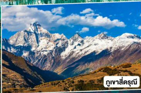
ภูเขาสัครุณี