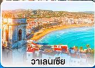
วาเลนเซีย