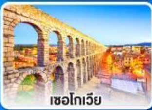
เซโกเวีย