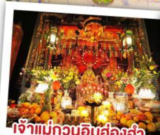
เจ้าแม่กวนอิมฮ่องฮ่า