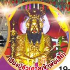
เอียงบูซิว (ศาลเจ้าพ่อลี)