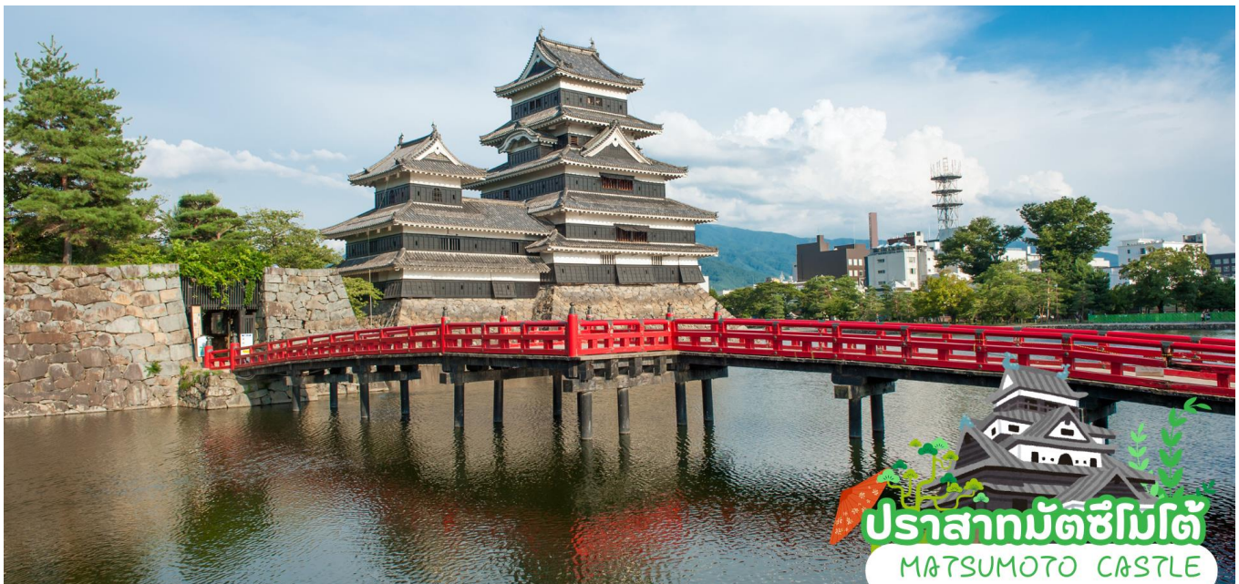
ปราสาทมัตสึโมโต้ MATSUMOTO CASTLE

หลังจากนั้น ออกเดินทางสู่ เมืองมัตสึโมโต้ เป็นเมืองที่สามารถท่องเที่ยวได้ทุกฤดูกาล ตั้งอยู่ตอนกลางของจังหวัดนากาโน่ เคยเป็นเจ้าภาพจัดการแข่งขันโอลิมปิกฤดูหนาวปี 1998 มัตสึโมโต้ตั้งอยู่บริเวณเชิงเขาของเทือกเขาแอลป์ญี่ปุ่น จึงทำให้เมืองทั้งเมืองถูกโอบล้อมไปด้วยภูเขาน้อยใหญ่ใจกลางประเทศญี่ปุ่น