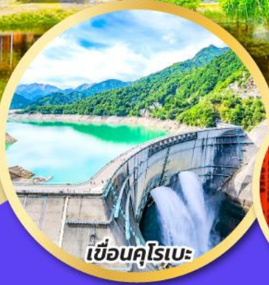
เขื่อนคุโรเบะ