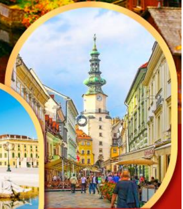
บราติสลาวา