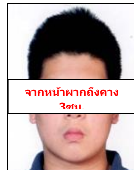
จากหน้าผากถึงคาง 3cm