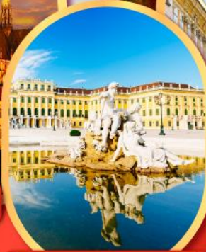
พระราชวังเซ็นบรูนน์