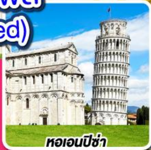
หออนปิซ่า