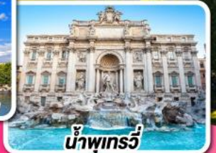
น้ำพุกรวี

09-18 พ.ค. 68 08-17 ส.ค. 68 16-25 พ.ค. 68 05-14 ก.ย. 68 30 พ.ค.-08 มิ.ย. 68 25 ก.ย.-04 ต.ค. 68 13-22 มิ.ย. 68 07-16, 16-25 ต.ค. 68