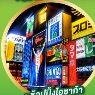
• ช้อปปิ้งโอซาก้า