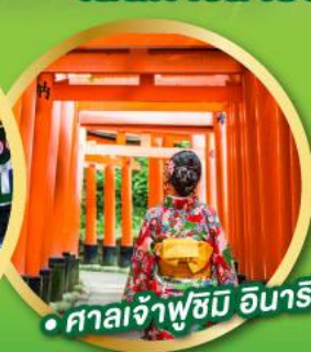
• ศาลเจ้าฟูชิมิ อินาริ

• ชมความงามของกำแพงหิมะ เส้นทางสายอัลไพน์ทาเคยาม่า (Japan Alps Snow wall)