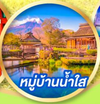
หมู่บ้านน้ำใส