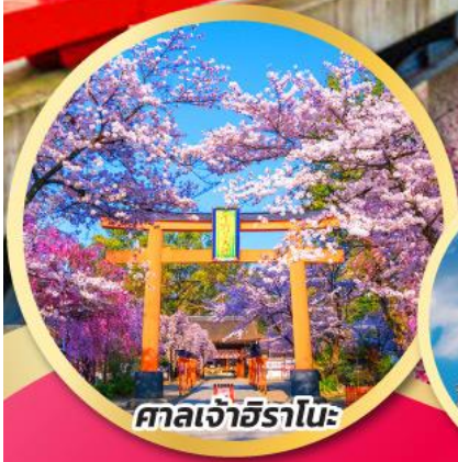
ศาลเจ้าอิราโนะ