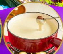
ฟองดูซีส