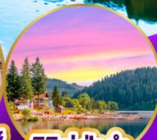
ทิกิเซ่ ปาด้า