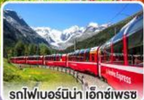
รถไฟเบอร์ลิน่า เอ็กซ์เพรส