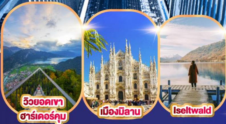
วิวยอดเขา ฮาร์เดอร์คุม