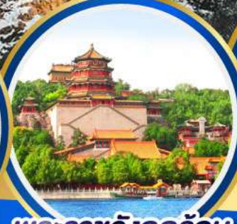
พระราชวังฤดูร้อน อู่เหอหยวน