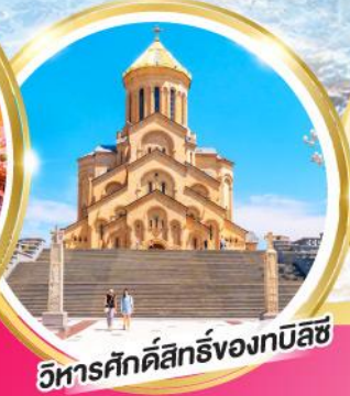
วิหารศักดิ์สิทธิ์ของทบิลีซี