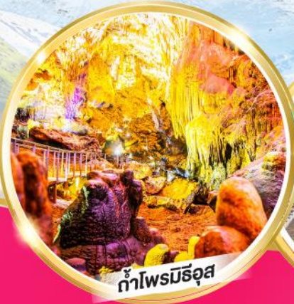
ถ้ำไฟรมีริอุส