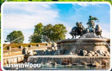
นาพินฟ็อู