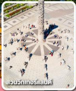
สวนจึกเกอร์แลนด์