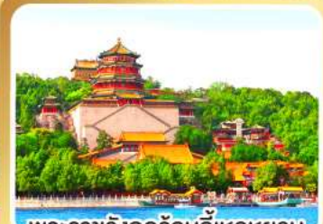
พระราชวังฤดูร้อนอ้อเหอหยวน