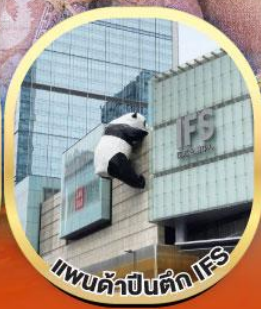
แพนด้าป็นตึกIFS