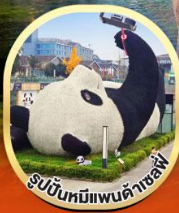
รูปปั้นหมีแพนด้าเซลฟ์