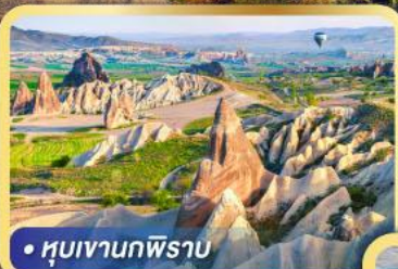
• หุบเขากพิราบ