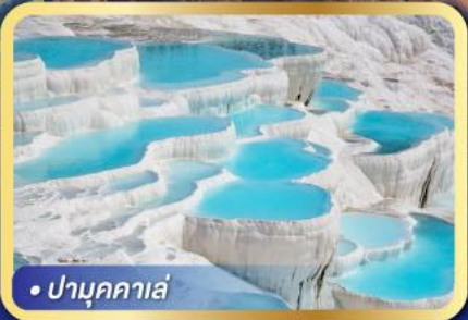
• ปามุกคาล่