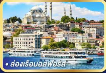
• ล่องเรืออิสฟอรุส