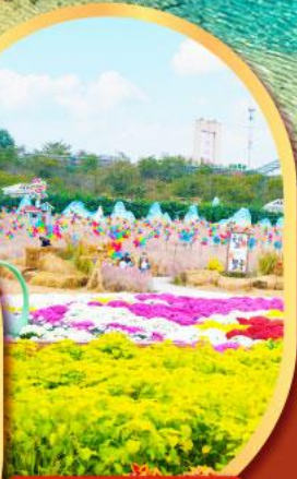
สวนสวรรค์แห่งดอกไม้ Manhua Manor