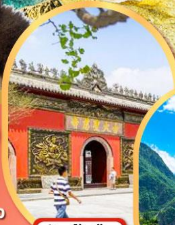
วัดต้าฉี