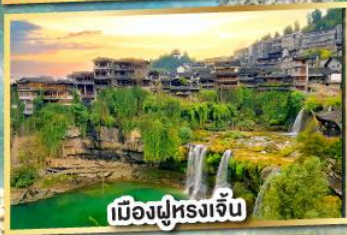
เมืองฝูหลงจั้น