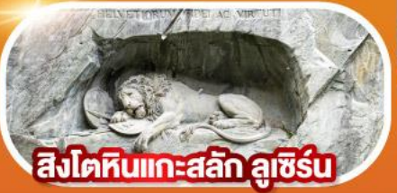
สิงโตหินแกะสลัก ลูซีร์น

พิชิตยอดเขาจุงเฟรา ขึ้นกระเช้าชมยอดเขาแมทเทอร์ฮอร์น