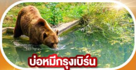
บ่อหมีกรุงเบิร์น