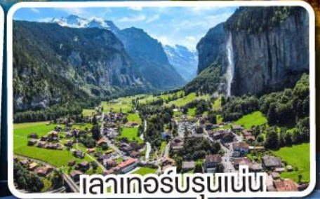
เลาเทอส์บรุนเนน

เดินทาง 12-18 มี.ค. 68 28 มี.ค.-03 เม.ย. 68 10-16 เม.ย. 68 29 เม.ย.-05 พ.ค. 68