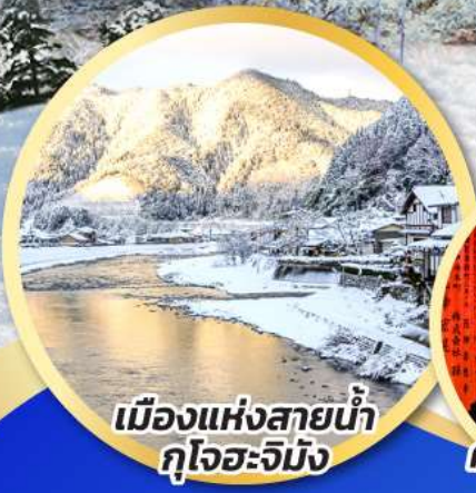
เมืองแห่งสายน้ำ กุงโจอะจิมัง