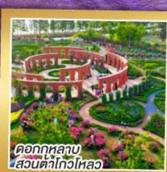
ดอกกุหลาบ สวนต้าโก้วไหลว