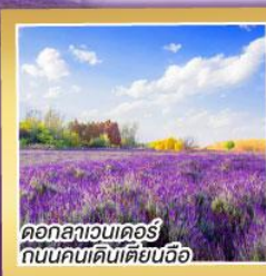
ดอกลาเวนเดอร์ ถนนคนเดินเดียนจื่อ