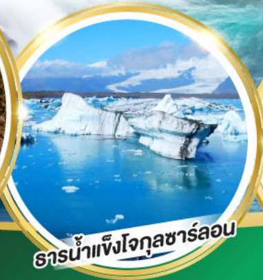
ธารน้ำแข็งโจกุลชาร์ลอน