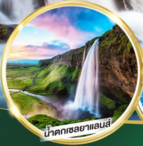
น้ำตกเซลยาแลนส์