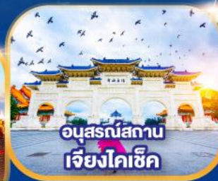
อนุสรณ์สถาน เจียงโคซึก