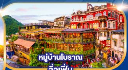
หมู่บ้านโบราณ จิวเฟิ่น