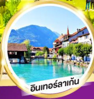
อินเทอร์ลาเก้น