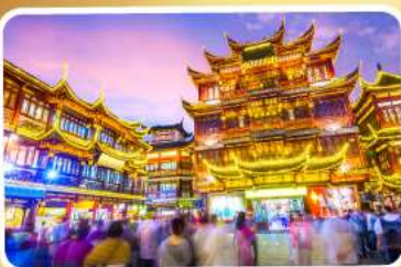
ตลาดร้อยปีเจิ้งหวงเมี่ยว