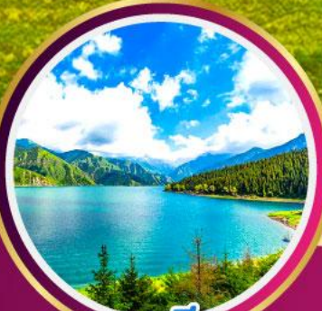
ทะเลสาบเทียนชาน