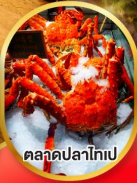
ตลาดปลาไทเป