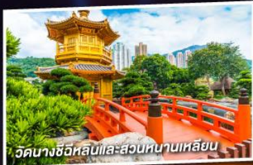
วัดนางชีวิหฺลันและสวนหยาดหนานเหลียน