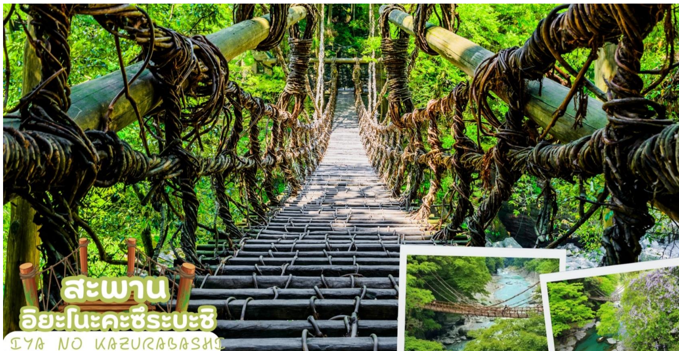
สะพาน อียะโนะคะชิระบะชิ IYA NO KAZURABASHI

นำท่านขอพร ศาลเจ้าโคโตอิระกุ (Kotohira-gu Shrine) หรืออีกชื่อหนึ่งว่า คัมปิระซัง (Konpira san) ตั้งอยู่บนภูเขาโซซุ จังหวัดคางาวะ (Kagawa) ในเมืองโคโตอิระที่สถิตของเทพเจ้าแห่งทะเลจึงเป็นที่เคารพบูชาของชาวเรือ และเป็น 1 ใน 88 ศาลเจ้าและวัดแห่งการแสวงบุญบนเกาะชิโกะกุ ที่ศาลเจ้าแห่งนี้ยังสามารถสักการะ Juichimen-Kannon หรือเจ้าแม่กวนอิม 11 พักตร์ได้ด้วย การเดินขึ้นไปศาลเจ้าจะต้องขึ้นบันไดกว่า 800 ขั้น และหากต้องการเดินขึ้นไปยังศาลเจ้าชั้นในสุด จะต้องเดินต่ออีก 1,368 ขั้น นอกจากนี้ระหว่างทางเดินก่อนมาถึงศาลเจ้าจะผ่านถนนที่มีร้านค้าตั้งอยู่มากมาย