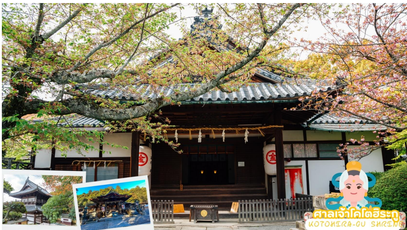
ศาลเจ้าโคโตอิระกุ KOTOHIRA-GU SHRINE

นำท่านขอพร ศาลเจ้าโคโตอิระกุ (Kotohira-gu Shrine) หรืออีกชื่อหนึ่งว่า คัมปิระซัง (Konpira san) ตั้งอยู่บนภูเขาโซซุ จังหวัดคางาวะ (Kagawa) ในเมืองโคโตอิระที่สถิตของเทพเจ้าแห่งทะเลจึงเป็นที่เคารพบูชาของชาวเรือ และเป็น 1 ใน 88 ศาลเจ้าและวัดแห่งการแสวงบุญบนเกาะชิโกะกุ ที่ศาลเจ้าแห่งนี้ยังสามารถสักการะ Juichimen-Kannon หรือเจ้าแม่กวนอิม 11 พักตร์ได้ด้วย การเดินขึ้นไปศาลเจ้าจะต้องขึ้นบันไดกว่า 800 ขั้น และหากต้องการเดินขึ้นไปยังศาลเจ้าชั้นในสุด จะต้องเดินต่ออีก 1,368 ขั้น นอกจากนี้ระหว่างทางเดินก่อนมาถึงศาลเจ้าจะผ่านถนนที่มีร้านค้าตั้งอยู่มากมาย