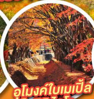
อุโมงค์ใบเมเปิ้ล โมมิจิ โคโร