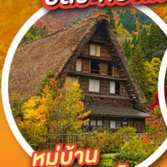
หมู่บ้าน ชิราคาวาโกะ

พักออนเซ็น 2 คืน พักโตเกียว 2 คืน อิสระท่องเที่ยว 1 วันเต็ม