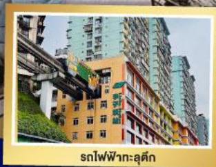
รถไฟฟ้าทะลุคัง