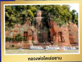
หลวงพ่อดิล่่อซาน