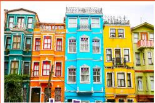
ย่านบัสลาห์