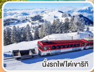
นั่งรถไฟโตเงาริก