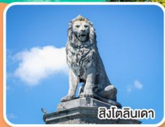
สิงโตลิบเดา