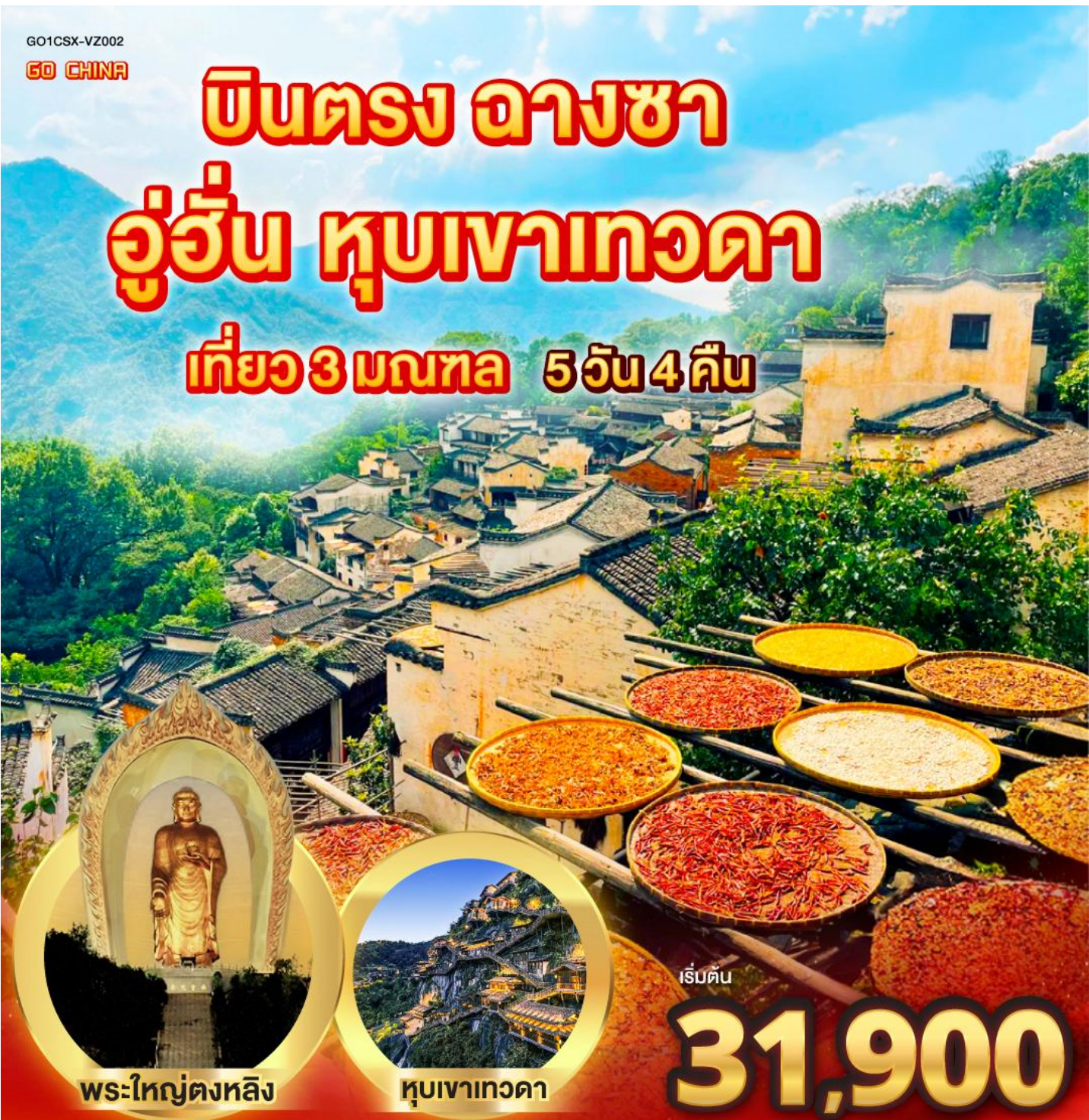
พระใหญ่ตงหลิง