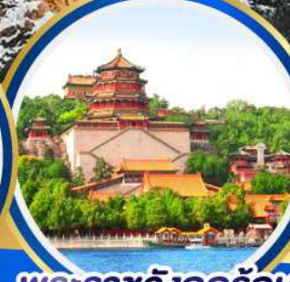
พระราชวังฤดูร้อน อู่เหอหยวน