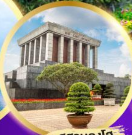
สุสานลุงโฮ