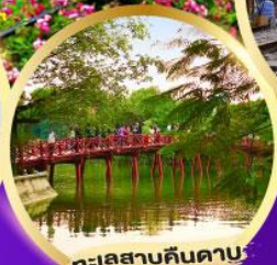
ทะเลสาบคินดาบ