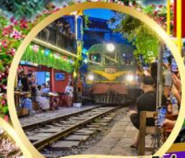
ร้านกาแฟฟรตโฟ