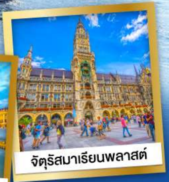
จัตุรัสมาเรียนพลาสต์