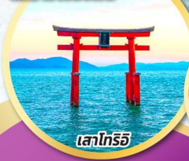
ทะเลโทริอิ