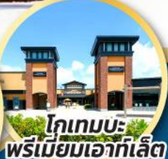
โทเทมบะ-พรีเมียมเอาก์เล็ท