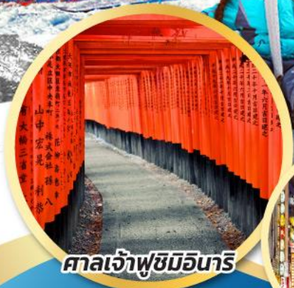
ศาลเจ้าฟุชิมิอินาริ