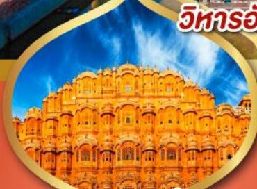
พระราชวัง สายลม