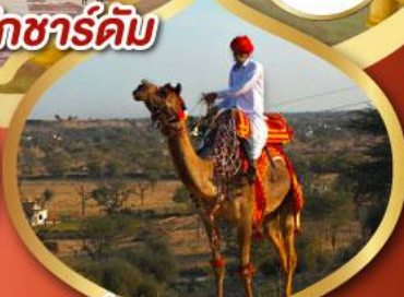
ฟรี ژیู่ซู เมืองมันทวา ราคาเริ่มต้น