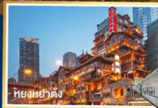
เที่ยงหย่าคัง