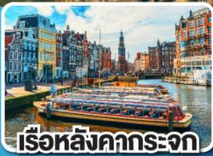
เรือหลังคากระจก