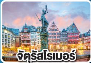
จัตุรัสโรเมอร์