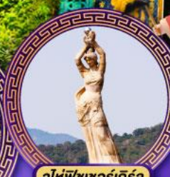
จูไห่พิพิธภัณฑ์