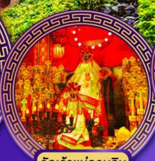
วัดเจ้าแม่กวนอิม ฮ่องฮ่า