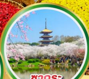
ชากระ ทะเลสาบตงหู