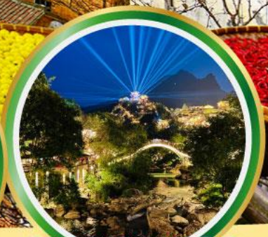
หุบเขาทวดา