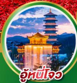
อุ๋นซีโจว