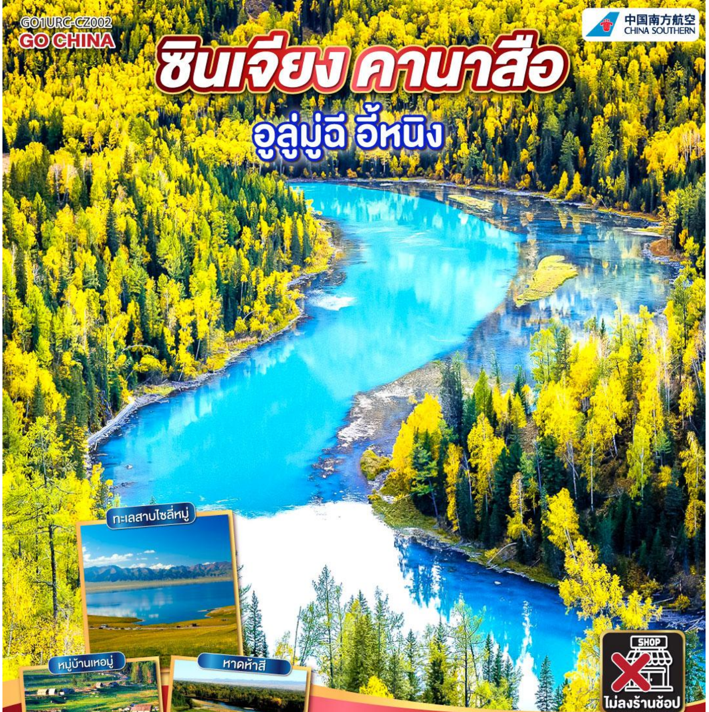
ทะเลสาบไซลีหมู่